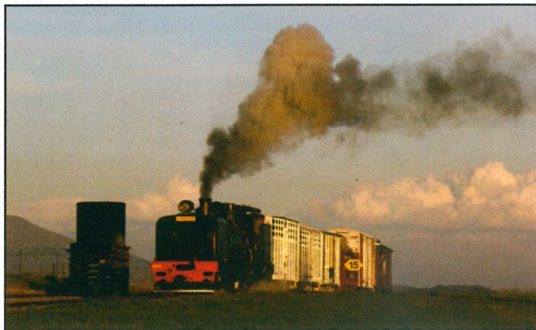
La Garratt NGG 13 n° 49 (Hanomag 1928) au croisement de Mooihoek.