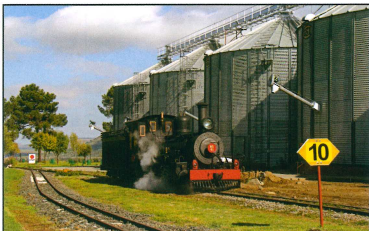
La Pacific NG 10 n° 61 passe devant les silos de la ferme de Hoekfontein.